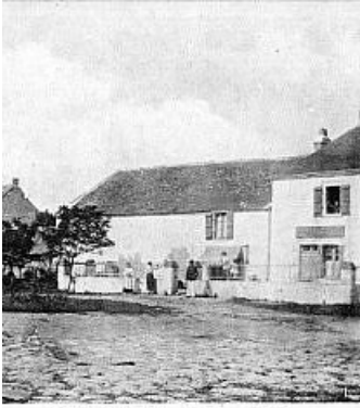
BOUÉE (Loire-Inférieure) - Bureau de Robars