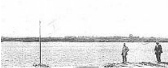
(Loire-inf.) - Le Port de Robars, La Loire et l'Île Pipi